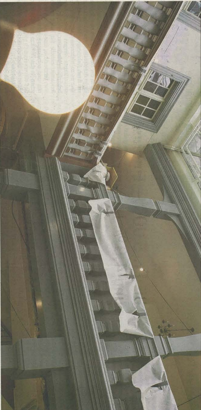
Mehr Licht, mehr Raum. Der Innenhof der Schlüsselzunft wird renoviert und dabei auch grösser und luftiger gemacht.